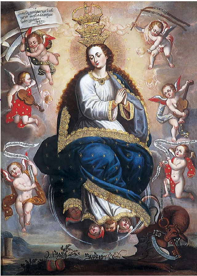
La Vergine Maria schiaccia il serpente dell'eresia, di Basilio de Santa Cruz Pumacallao, † 1710 a Cusco in Perù

permittente, immisit diluvium super terram et lucifer, permittente Deo lucis reservavit Noe et socios suos.