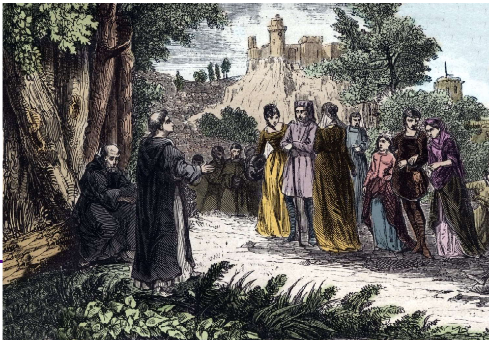
San Domenico predica agli albigesi, incisione del 1846 in Vite dei Santi , da MeisterDrucke.

È questa una fede mostrata anche in due pergamene del 24 e 26 giugno 1229 rogata a Perugia dal notaio Ranuccio a seguito dell'abiura di certi Andrea e Pietro patarini fatta davanti a dom Ciriaco, abate di San Miniato al Monte di Firenze, presenti papa Gregorio IX, arcivescovi, vescovi, cappellani e una moltitudine di gente.